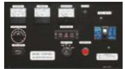
Панель управления: YEG500DSHC Панель управления: YEG500DTHC