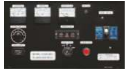
Панель управления: YEG450DSL Панель управления: YEG450DTLS